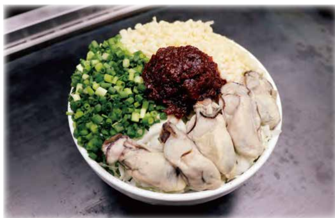
台湾夜市風カキの XO もんじゃ焼き