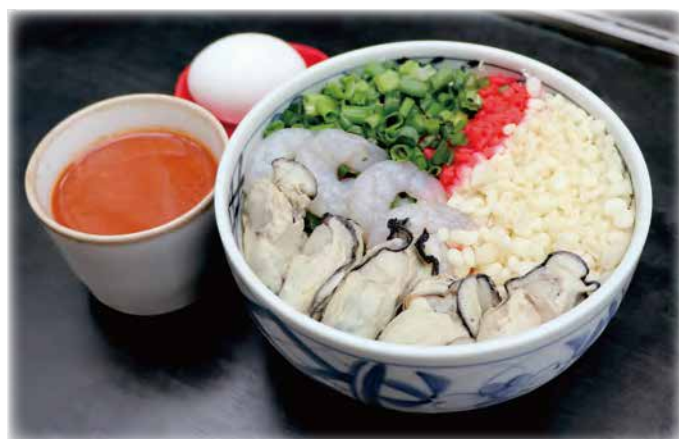
台湾夜市風カキのお好み焼き